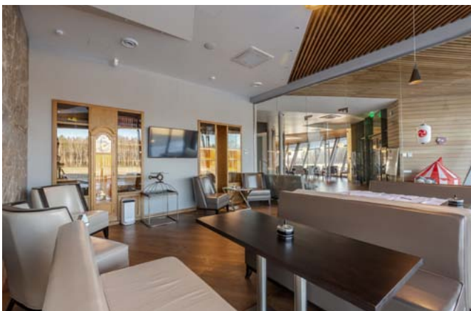
Здесь можно провести переговоры

проводить теоретические занятия в прекрасных условиях. В конференц-зале и учебном классе можно использовать мультимедийную доску или просматривать и разбирать тренировочные полеты.