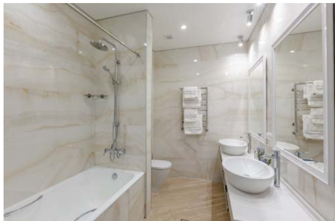
Ванная в номере люкс