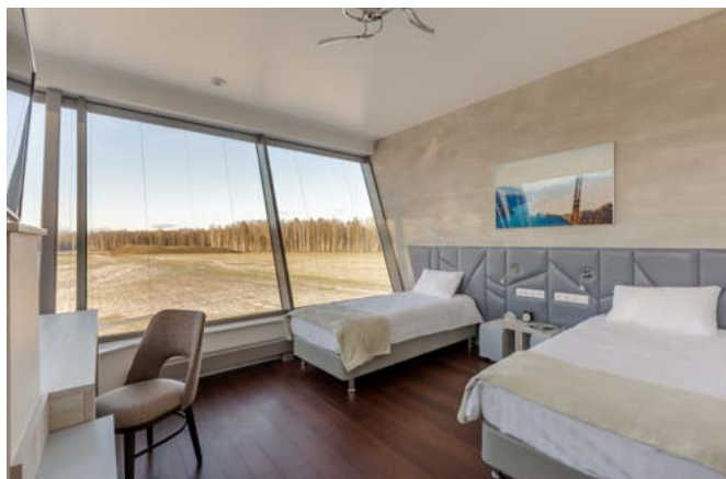
Из номеров открывается завораживающий вид