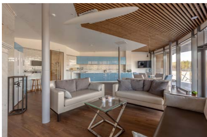
Комната отдыха экипажей